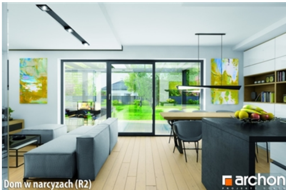
Dom w narcyzach (R2)

Cena Powierzchnia Typ domu Liczba pokoi 810 500 PLN 124,90 m2 Bliźniak 5